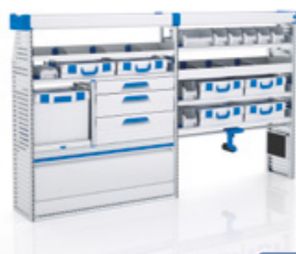
FTR 14 MI LI-3

▶ L x P x H = 2456 x 382 x 1308 mm Poids : 89 kg environ