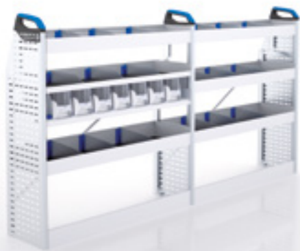
FTR 14 MI LI-1