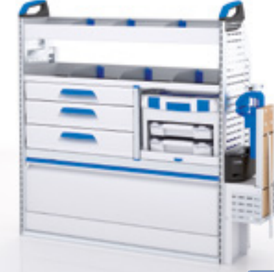
FTR 14 MI RE-3

▶ L x P x H = 1246 x 382 x 1308 mm Poids : 48 kg environ