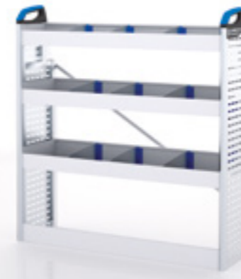
FTR 14 MI RE-1