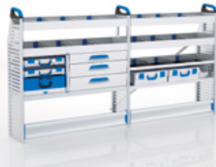
FTR 14 MI LI-2

▶ L x P x H = 2456 x 382 x 1308 mm Poids : 58 kg environ