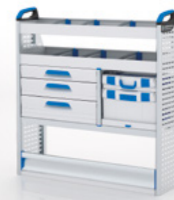
FTR 14 MI RE-2

▶ L x P x H = 1246 x 382 x 1308 mm Poids : 27 kg environ